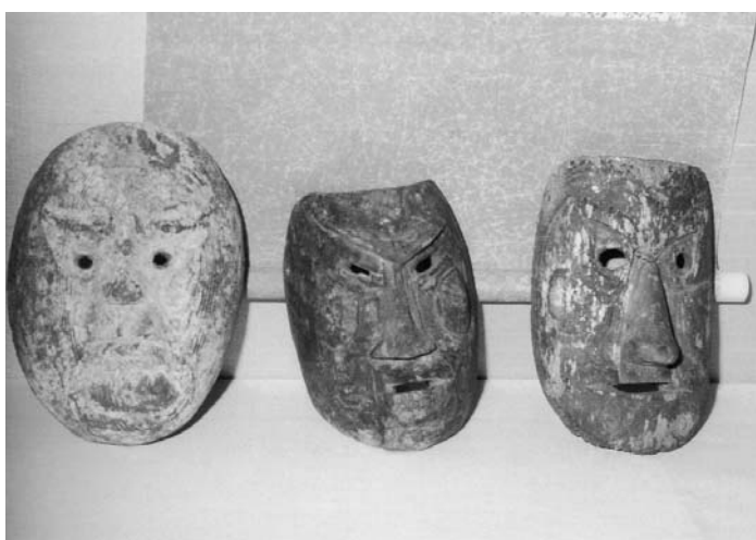
村有形文化財（美術工芸）能面（彫刻） （美郷村大字別枝山字平 平八幡神社）