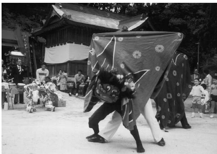
村民族文化財（無形）平八幡神社奉納獅子舞