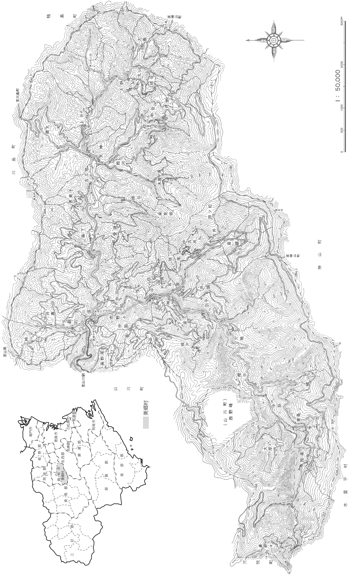
地図は美郷村役場発行の「美郷村全図」(建設省国土地理院承認番号 昭60複、第110号)による。