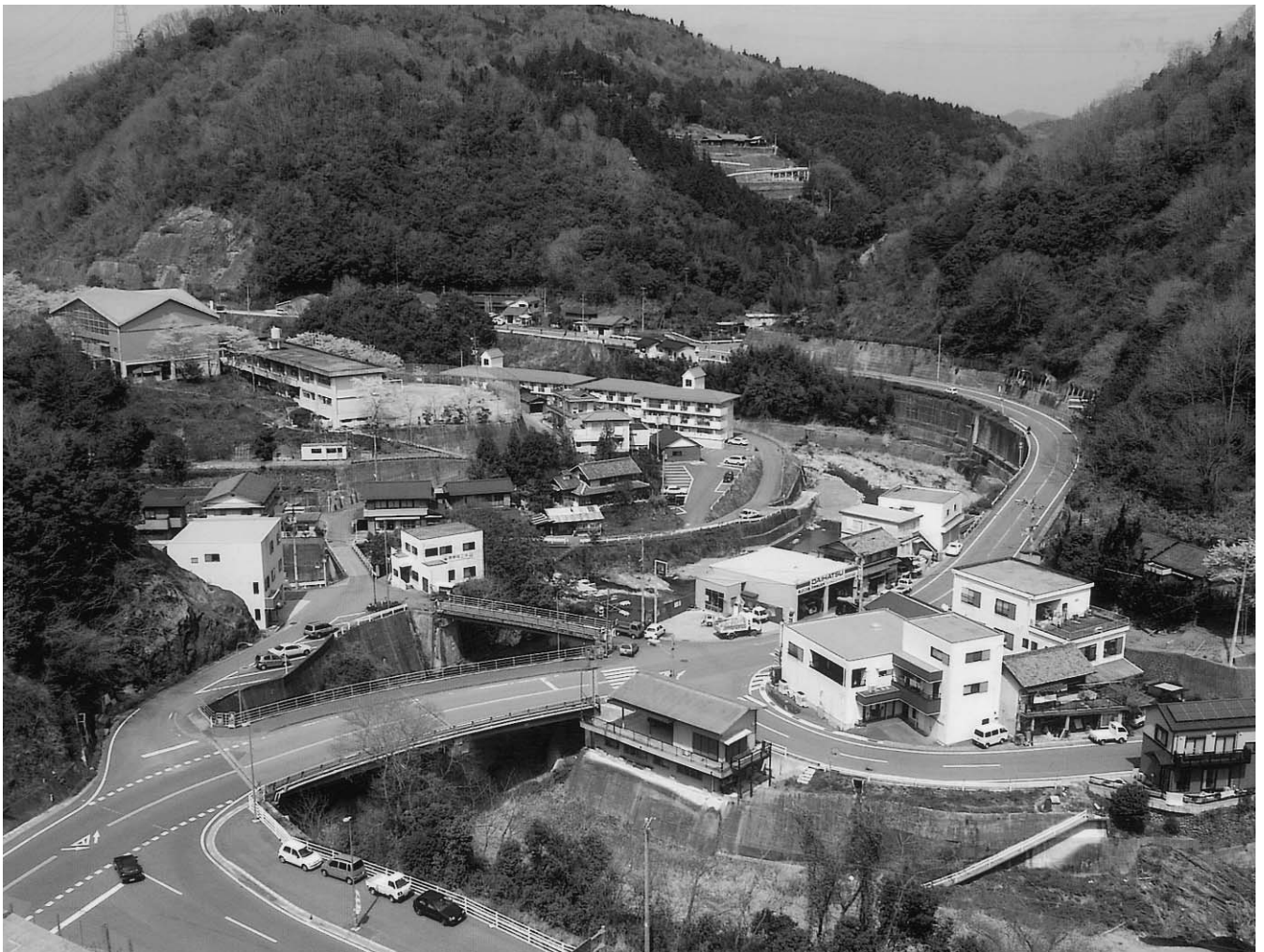
役場周辺集落（美郷村字川俣）