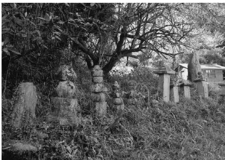
村有形文化財 (建造物) 谷の四足堂及び周辺石造物群 (美郷村大字別枝山字大神)