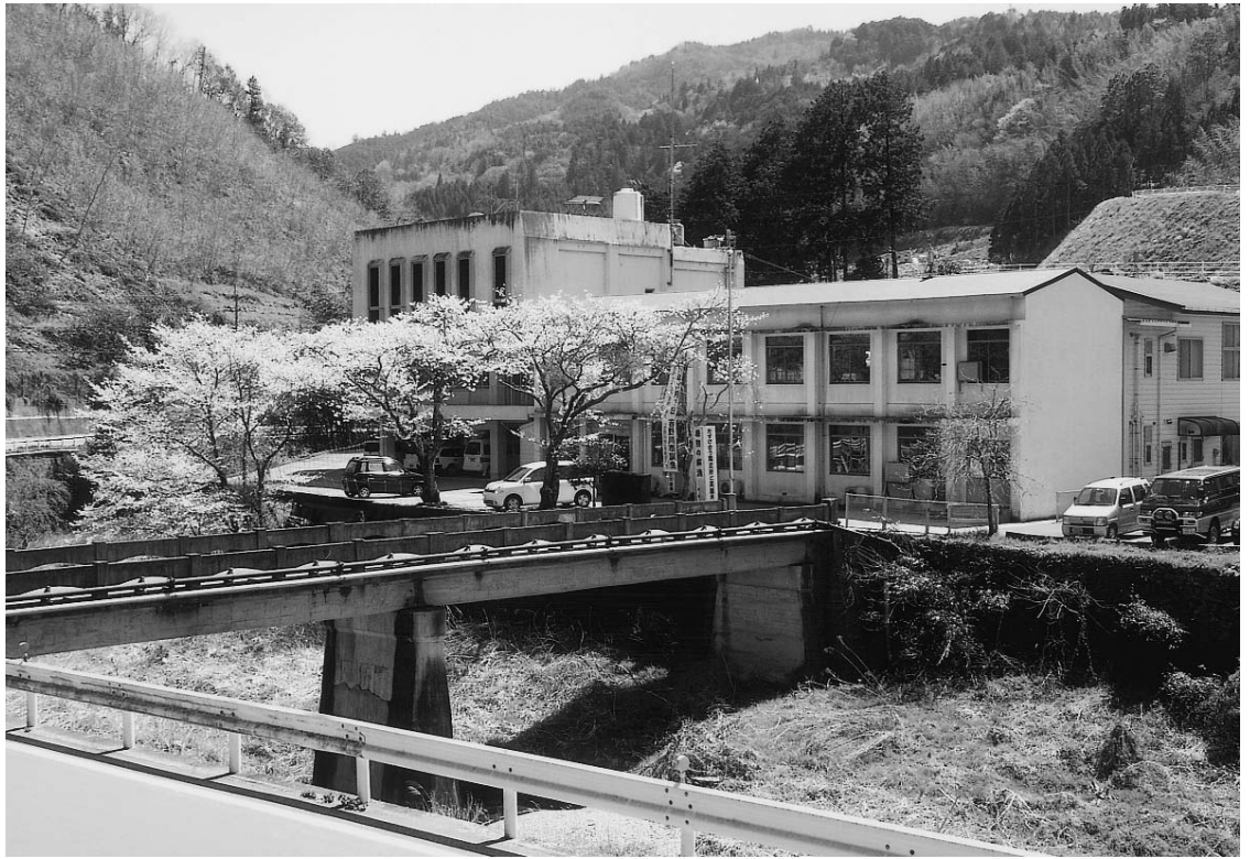
美郷村役場（昭和36年竣工）