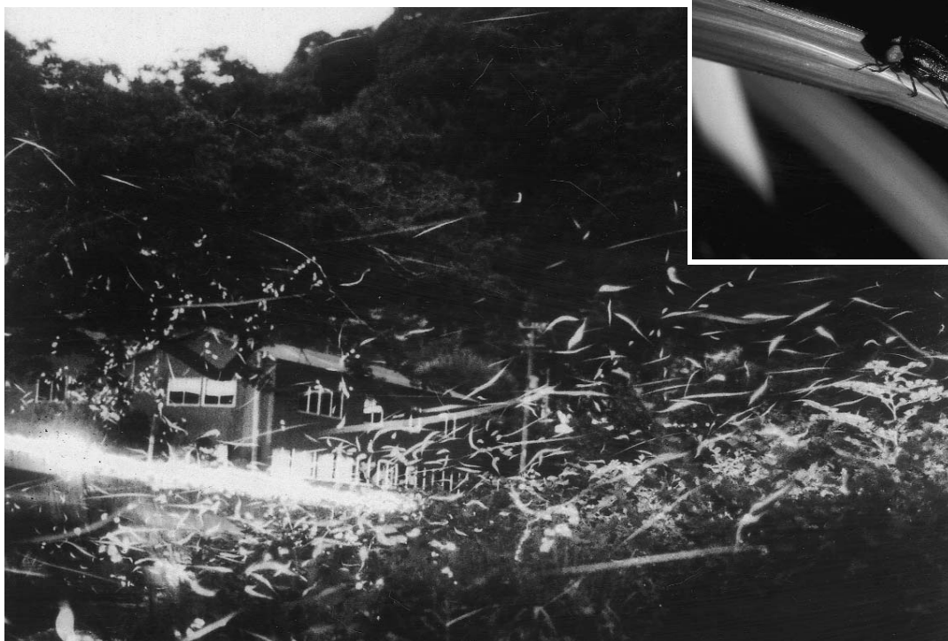
国指定天然記念物「美郷のホタルおよびその生息地」（全村指定）