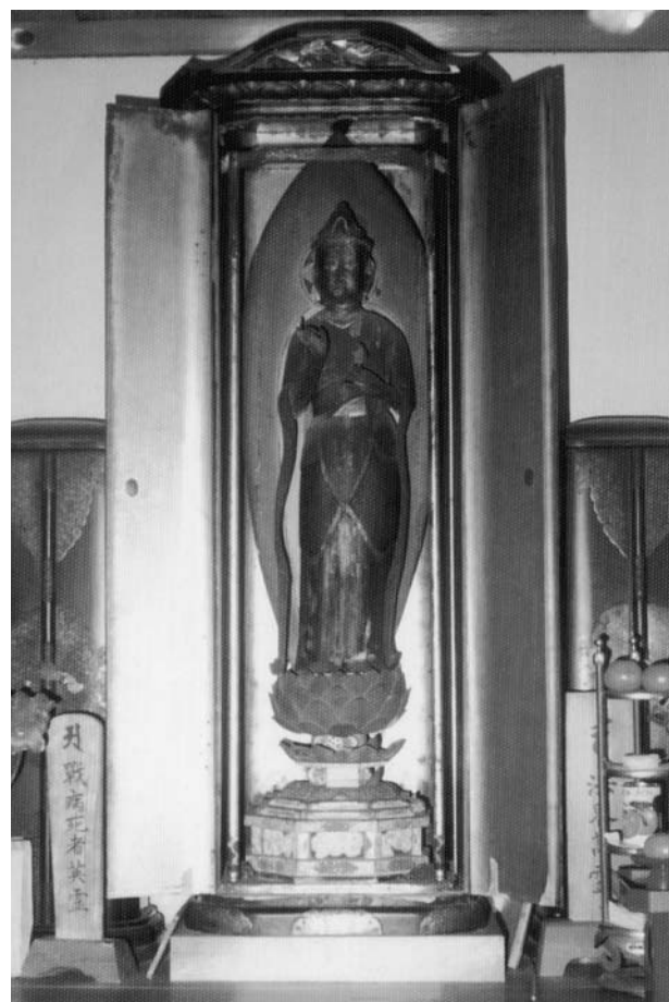
村有形文化財（美術工芸）聖観世音像彫刻 （美郷村大字別枝山字宮倉 重楽寺）