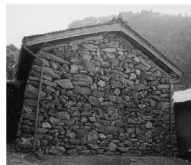
石倉 (美郷村字中谷)