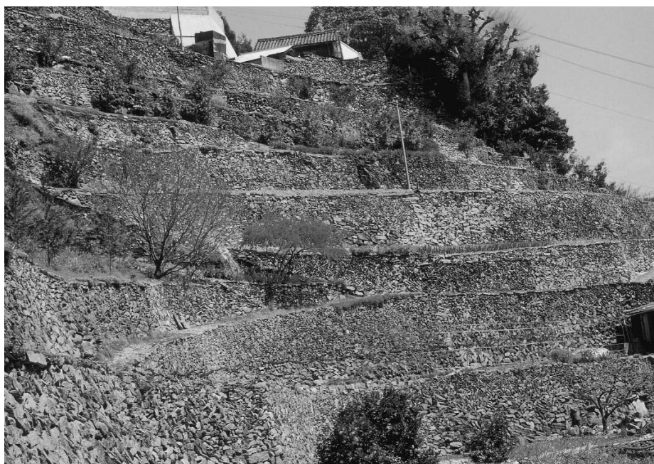
文化庁選定 農林水産業に関する文化的景観 高開の石積み (美郷村大字別枝山字大神)